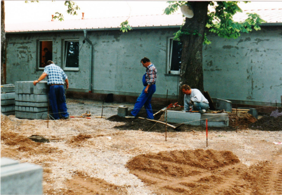
Der weitere Ausbau des Vorplatzes im Mai 1999